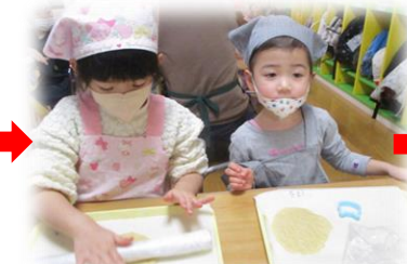
生地をうすく伸ばして