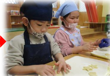
好きな型で抜いて